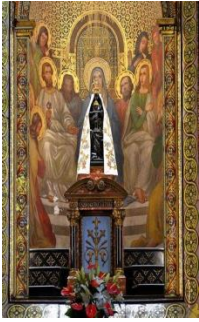
ND de Liesse